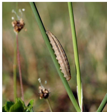
Sandrandøje – Larve (www.dansk-natur.dk)